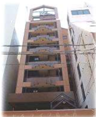
エクセルライフ島之内