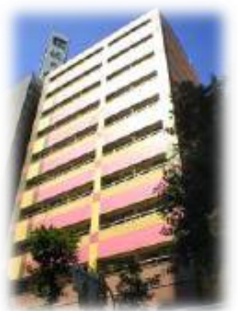
フレアコート北浜I