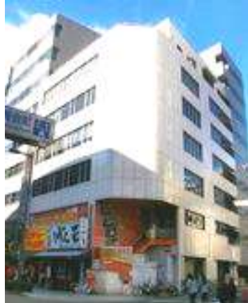
タイヨービル(大阪)