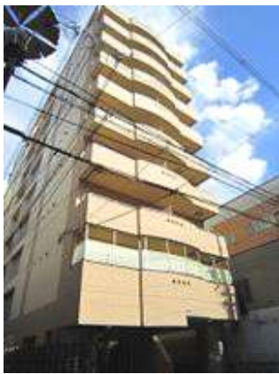
メゾン・デ・ノムラ東心齋橋