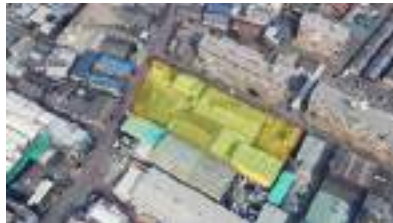
八尾市桂町 事業用地