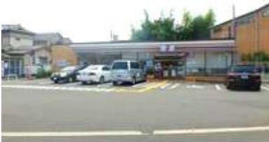
吹田市岸部北 コンビニ店舗