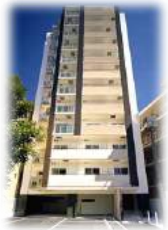
フレアコート新大阪