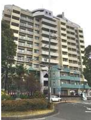
グランドメゾン草津東