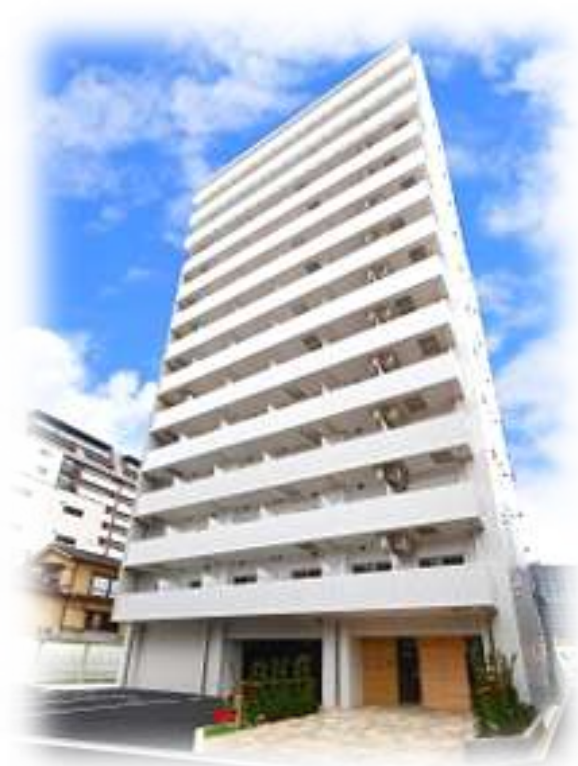
フレアコート梅田