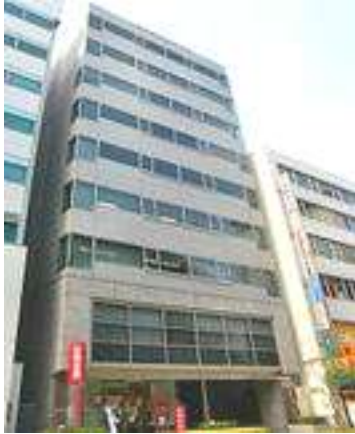
なんばアリーナビル(大阪)