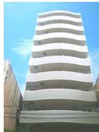
シャンクレール南久宝寺