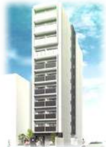
フレアコート北浜II