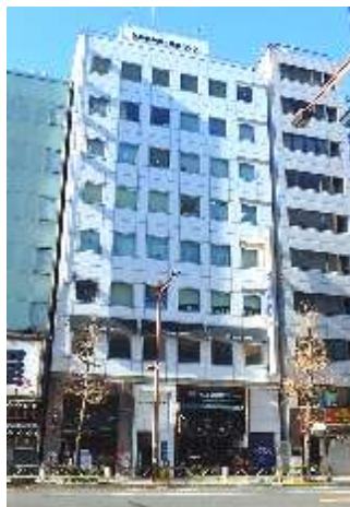
第二登栄ビル(東京)