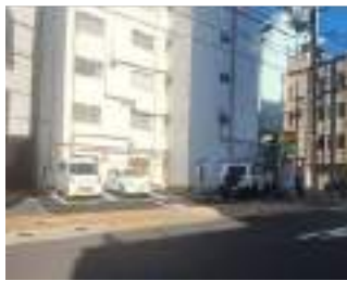
東京都台東区 事業用地