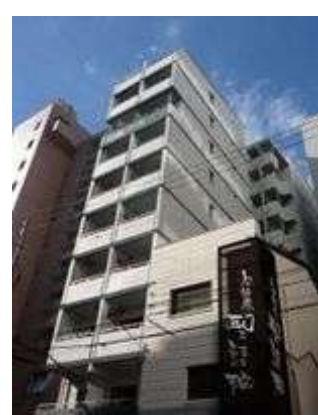
シティーサイドステージ福島