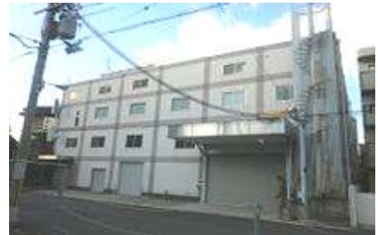
東淀川区瑞光 倉庫