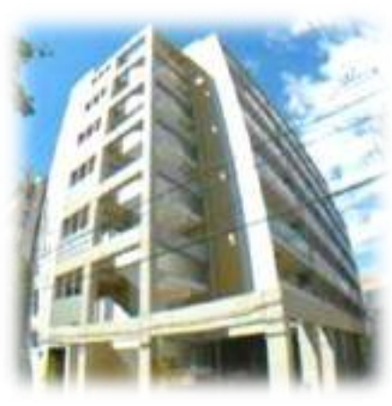
フレアコート甲南