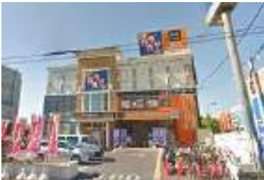
東大阪市荒本西 ロードサイド店舗