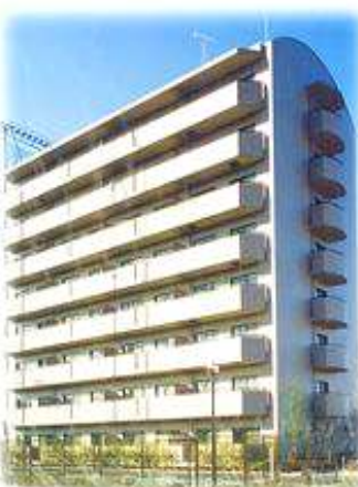
アヴェニール出戸