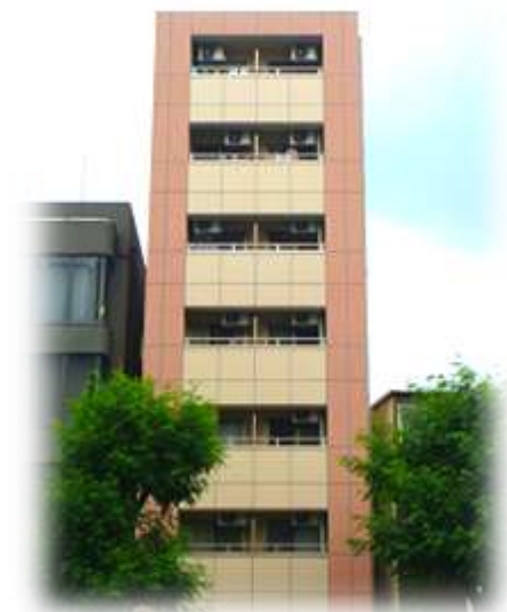
フレアコート堀越町