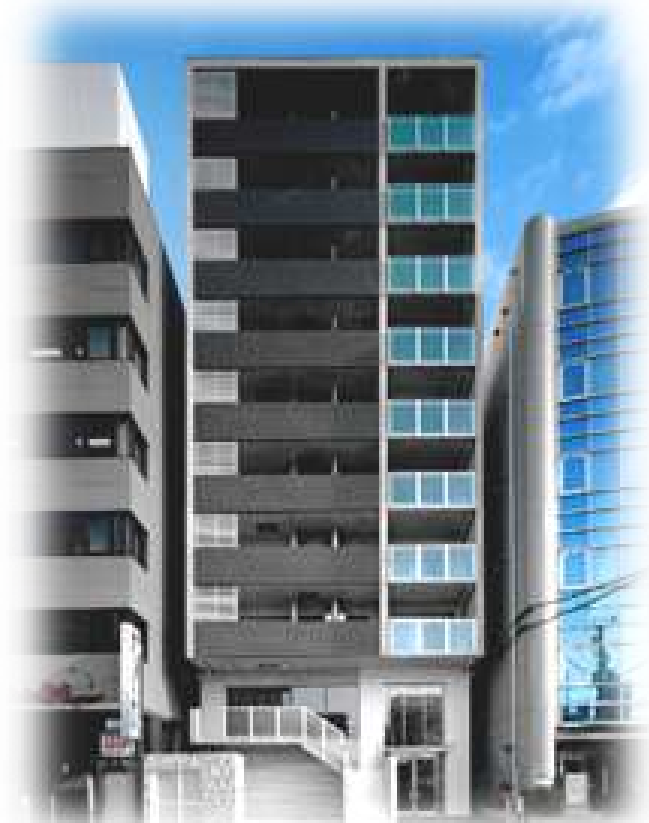
フレアコート江坂