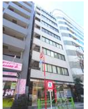
八重洲長岡ビル(東京)