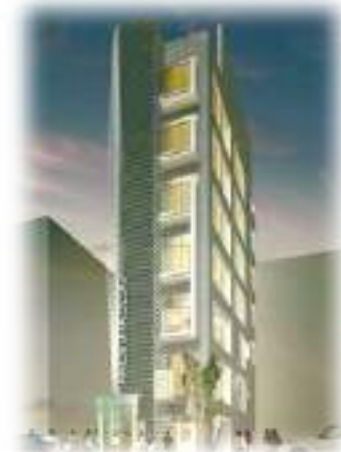
アメモラビルディング