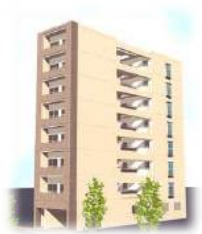
フレアコート北久宝寺