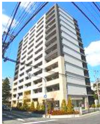
メロディア新北野