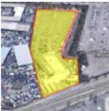
八幡市 事業用地(京都)