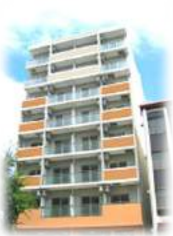
フレアコート奈良