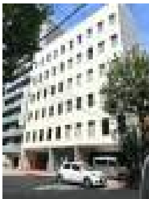
文芸社東神田ビル(東京)