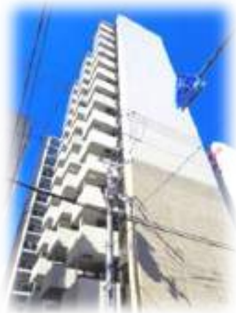
フレアコート谷町4丁目